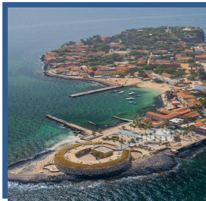
Île de Gorée